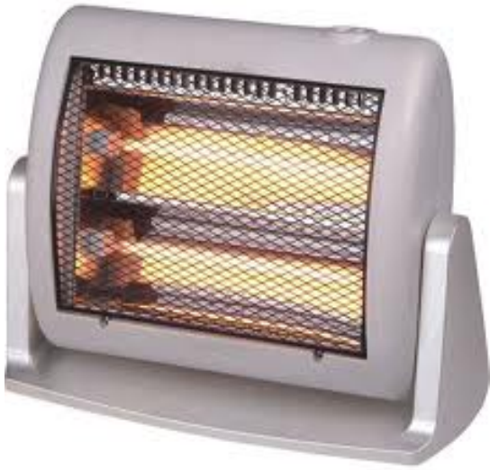
English: electric heater Deutsch: Die Elektro-Heizung Slovensky: elektrický ohrievač