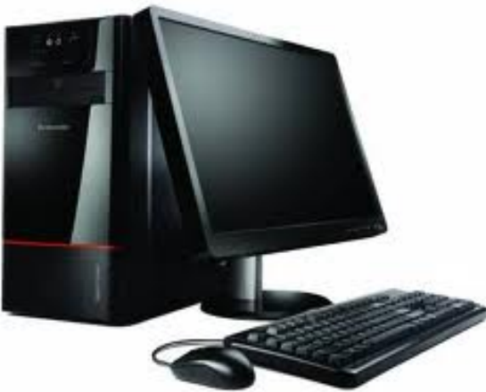
English: computer Deutsch: der Computer Slovensky: počítač

Námety pre zábavno-poučné vyučovanie s témou ekologickej stopy Téma: Elektrina Stupeň: ZŠ Aktivita: ŽRÚTI ENERGIE V DOMÁCNOSTI