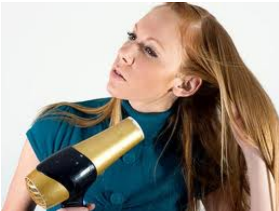
English: hair dryer Deutsch: der Haartrockener, der Fön Slovensky: sušič vlasov