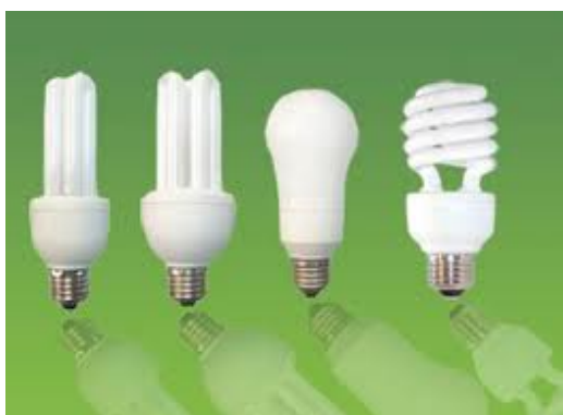
English: fluorescent light bulb Deutsch: Die Leuchtstofflampe Slovensky: úsporná žiarivka