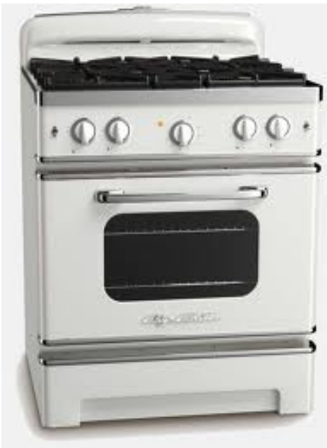
English: stove Deutsch: der Herd Slovensky: sporák