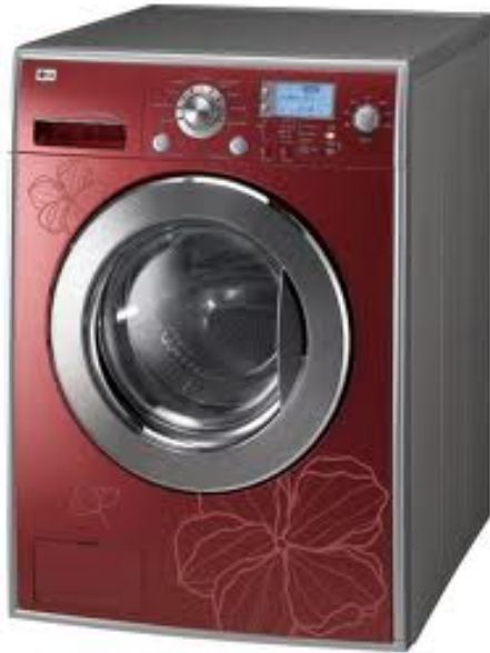
English: washmachine Deutsch: die Waschmaschine Slovensky: práčka