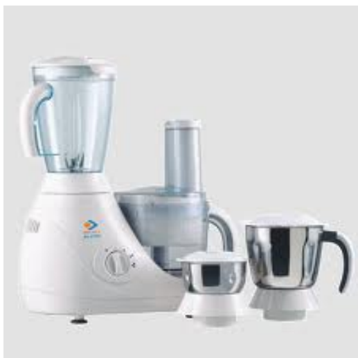
English: food processor Deutsch: die Küchenmaschine Slovensky: kuchynský robot