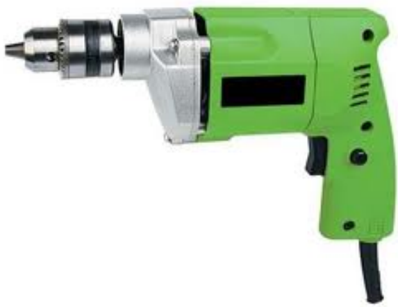
English: drill Deutsch: die Bohrmaschine Slovensky: vŕtačka