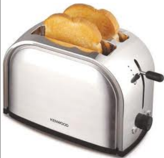
English: toaster Deutsch: Toaster Slovensky: toustovač

Námety pre zábavno-poučné vyučovanie s témou ekologickej stopy Téma: Elektrina Stupeň: ZŠ Aktivita: ŽRÚTI ENERGIE V DOMÁCNOSTI